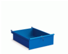
Cajón FAHER para bancos de trabajo