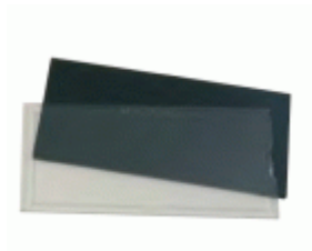
Protector policarbonato FAHER transparente